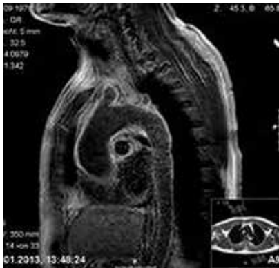
Darstellung einer Aortitis im MRT der Aortenwand – es ist bereits eine Aufweitung der Aorta infolge der Entzündung erkennbar.

gut untersucht werden. Die entzündete, verdickte Gefäßwand stellt sich als echoarmer, dunkel erscheinender Randsaum dar. Weitere Hinweise sind Gefäßverengungen (Stenosen). Diese Methode sollte möglichst rasch, bei entsprechender Symptomatik auch im Sinne eines Fast Track Verfahrens (vgl. Kasten S. 19) durch einen erfahrenen Untersucher eingesetzt werden und ist neben der ärztlichen Befund- und Anamneserhebung sowie dem Entzündungslabor in vielen Fällen die entscheidende Maßnahme. Mit der Magnetresonanztherapie (MRT) der Aortenwand lässt sich mittels Kontrastmittelgabe und spezieller Untersuchungstechnik (late enhancement-Bildgebung) die Entzündung der Aortenwand gut darstellen.